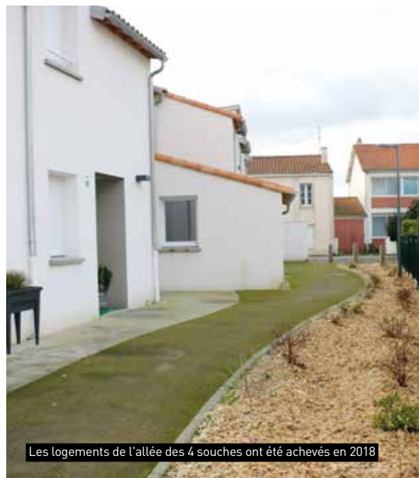
Les logements de l'allée des 4 souches ont été achevés en 2018