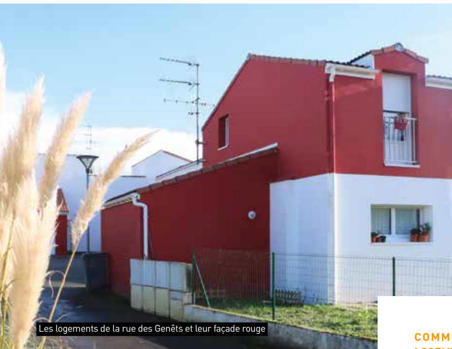
Les logements de la rue des Genêts et leur façade rouge